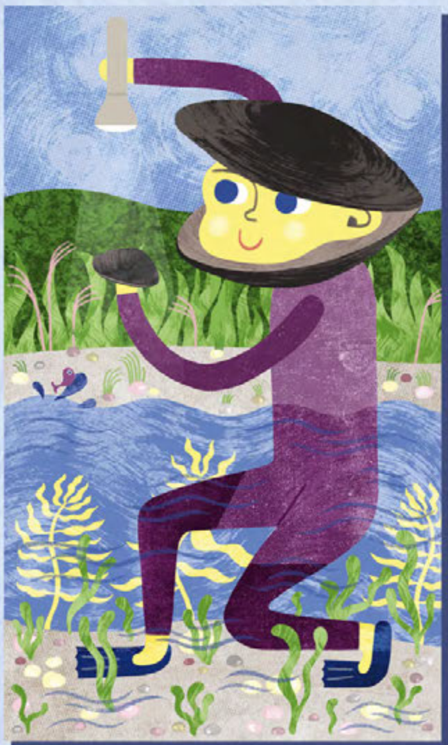
Botschafter-Figuren führen die Kinder durch die Ausstellung

Schloss Nymphenburg 80638 München Tel.: 0 89 / 17 95 89 - 0 mmn@snsb.de mmn-muenchen.de