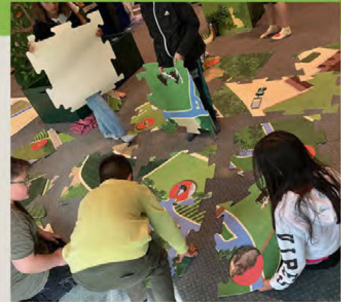
Beim Bodenpuzzle wird der Fluss in die Landschaft eingebettet