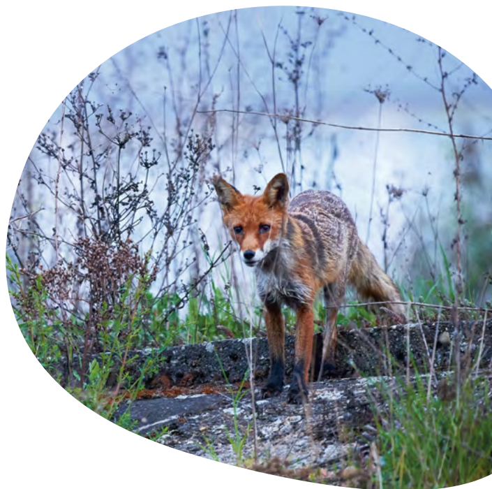
Bild links: Rabenkrähe, Karlsplatz Stachus, © Ingo Zahlheimer Bild rechts: Rotfuchs, S-Bahn Station Olympiapark, © Julius Kramer

Komm' mit auf einen Spaziergang durch das wilde München und lasse dich überraschen, was die Stadt so alles an tierischen Attraktionen zu bieten hat.