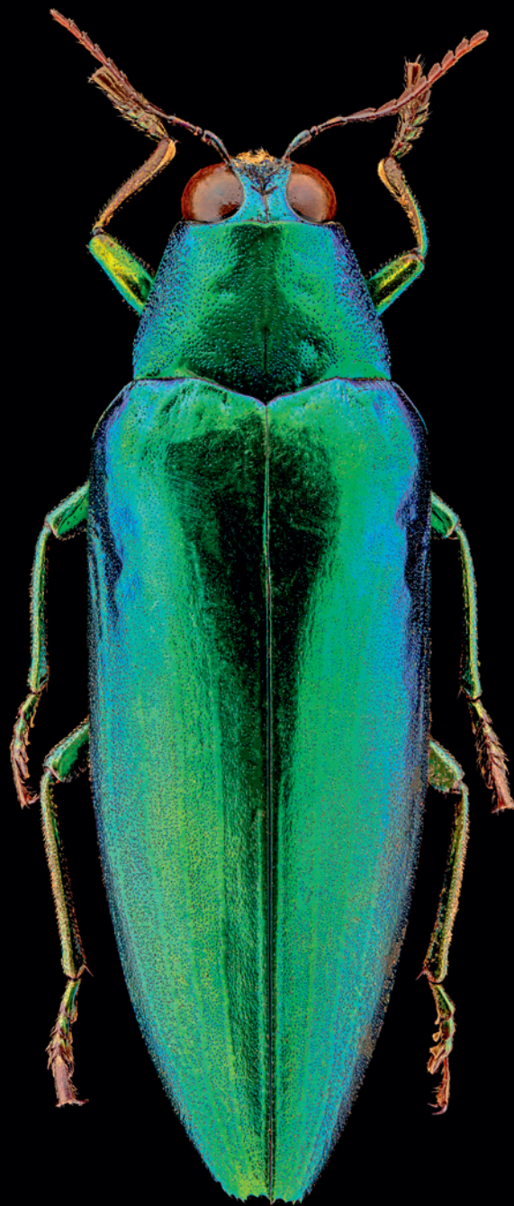
Chrysochroa wallacei DEYROLLE, 1864 Familie: Prachtkäfer (Buprestidae)

thomas.buechseemann@e-mail.de www.tropfenfotografie.mozello.de