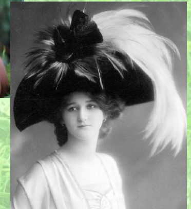
Hutmode aus dem Jahre 1909 mit Paradiesvogelbalg und Federn