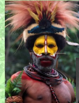
Junger Huli aus dem Hochland Papua-Neuguineas mit Paradiesvogel-Federschmuck

Seit Jahrtausenden werden Paradiesvögel von den Einwohnern Neuguineas und benachbarter Inseln gejagt, um als Schmuck, Statussymbol oder Zahlungsmittel Verwendung zu finden. Bis heute spielen sie eine große Rolle bei der Anfertigung beeindruckender Kopfschmucke, die bei festlichen Anlässen getragen werden. Ein solcher Anlass ist beispielsweise das berühmte Mount Hagen Sing-Sing, zu dem Tausende von Tänzern unterschiedlicher Gruppen zusammenkommen und das Besucher aus aller Welt anlockt. Paradiesvogelbälge spielten aber auch als Handelsware und Zahlungsmittel eine große Rolle. Neben Schweinen und Muschelschalen waren und sind sie zum Teil heute noch ein unverzichtbarer Teil des Brautpreises. Auch sonst wird bis heute mit Paradiesvögeln bezahlt, schmückt doch das Konterfei dieser Tiere die Münzen und Geldscheine Papua-Neuguineas ebenso wie vor etwa 100 Jahren die Neuguinea-Mark der deutschen Kolonie.