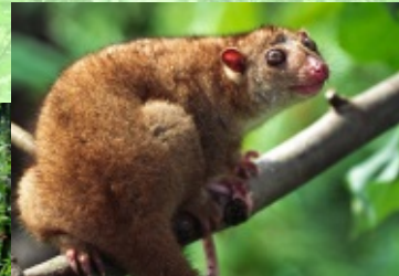
Die Regenwälder Neuguineas (links) beherbergen eine einmalige Tierwelt. Typisch sind u. a. Beuteltiere wie der Tüpfelkuskus ( Spilocuscus maculatus ).