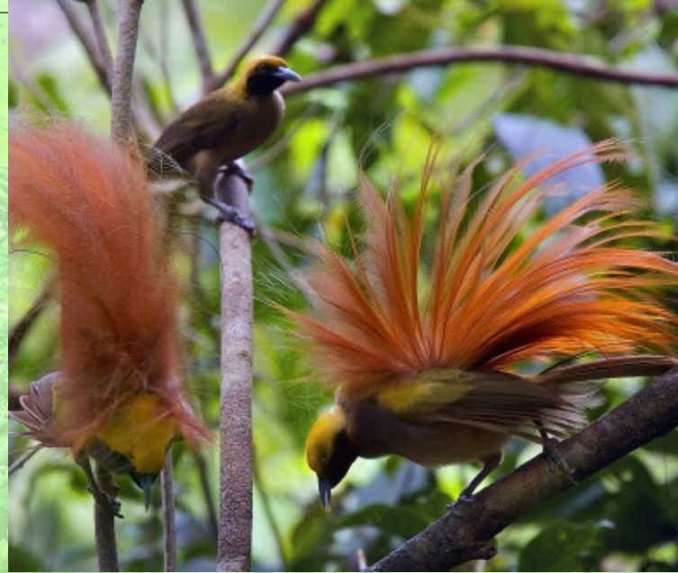
Schmuck-Paradiesvögel ( Paradisaea decora ) bei der Balz

Die gezeigten Präparate stammen vorwiegend aus der Sammlung von Prof. Dietrich von Holst, die 2009 mit Hilfe des Vereins der Freunde und Förderer des Museums Mensch und Natur erworben werden konnte. Daneben werden Leihgaben des Staatlichen Museums für Völkerkunde München, der Bayerischen Staatsgemäldegalerien, des Bayerischen Nationalmuseums sowie weiterer institutioneller und privater Leihgeber präsentiert.