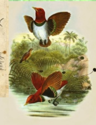
Königsparadiesvogel ( Cicinnurus regius ); aus Gould & Sharpe, 1878 - 88

Frühe Darstellungen wie diese Tafel aus Johannes Jonstons „Naturgeschichte der Vögel“ aus dem Jahre 1650 zeigen die Paradiesvögel als fuß- und teilweise auch flügellose Wesen, die in der Luft schweben.